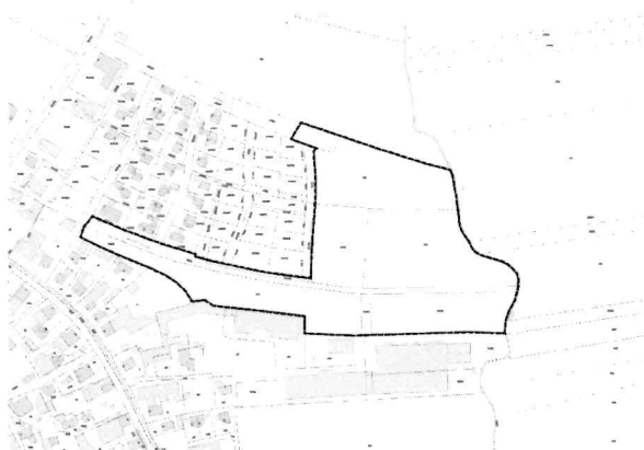
Abbildung 1: Geltungsbereich der gegenständlichen Flächennutzungsplanänderung, unmaßstäblich

Im Einzelnen gilt der Lageplan vom 27.02.2024. Die Lagepläne sind in folgenden Kartenausschnitten dargestellt: