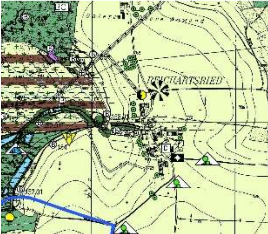
Abb. 1 Ausschnitt aus dem rechtswirksamen Flächennutzungsplan - ohne Maßstab